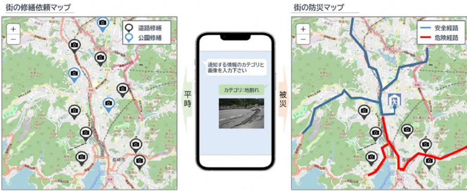
LINE を活用した被災現場の情報連携サービス

概要) LINEで画像を投稿。LINEプラットフォームからオープン系データ連携基盤に画像を連携し、地図上に可視化。