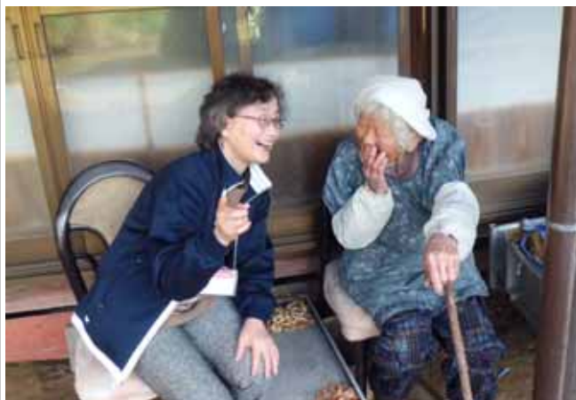
(地域福祉コーディネーター)

(4)もやいネットセンターや地域の見守り活動関係者からの安否不明にかかる連絡を受けて現地におもむき、関係者と協働し早期対応を実施