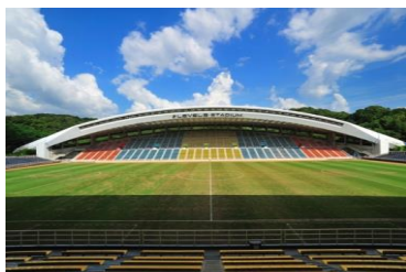
福岡県・福岡市 東平尾公園 博多の森球技場