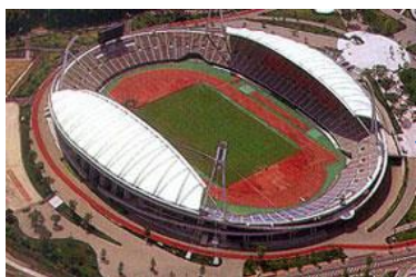
熊本県・熊本市 熊本県民総合運動公園 陸上競技場