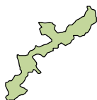
大分県 大分スポーツ公園 総合競技場