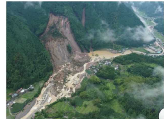
宝珠山日田線(日田市大字小野)