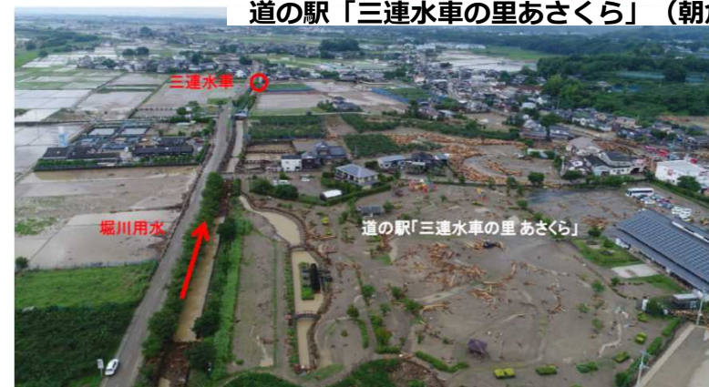
道の駅「三連水車の里あさくら」(朝倉市)