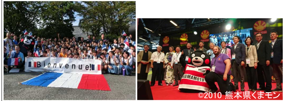
水前寺公園での歓迎セレモニー