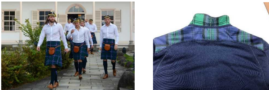
グラバー園を訪問した選手